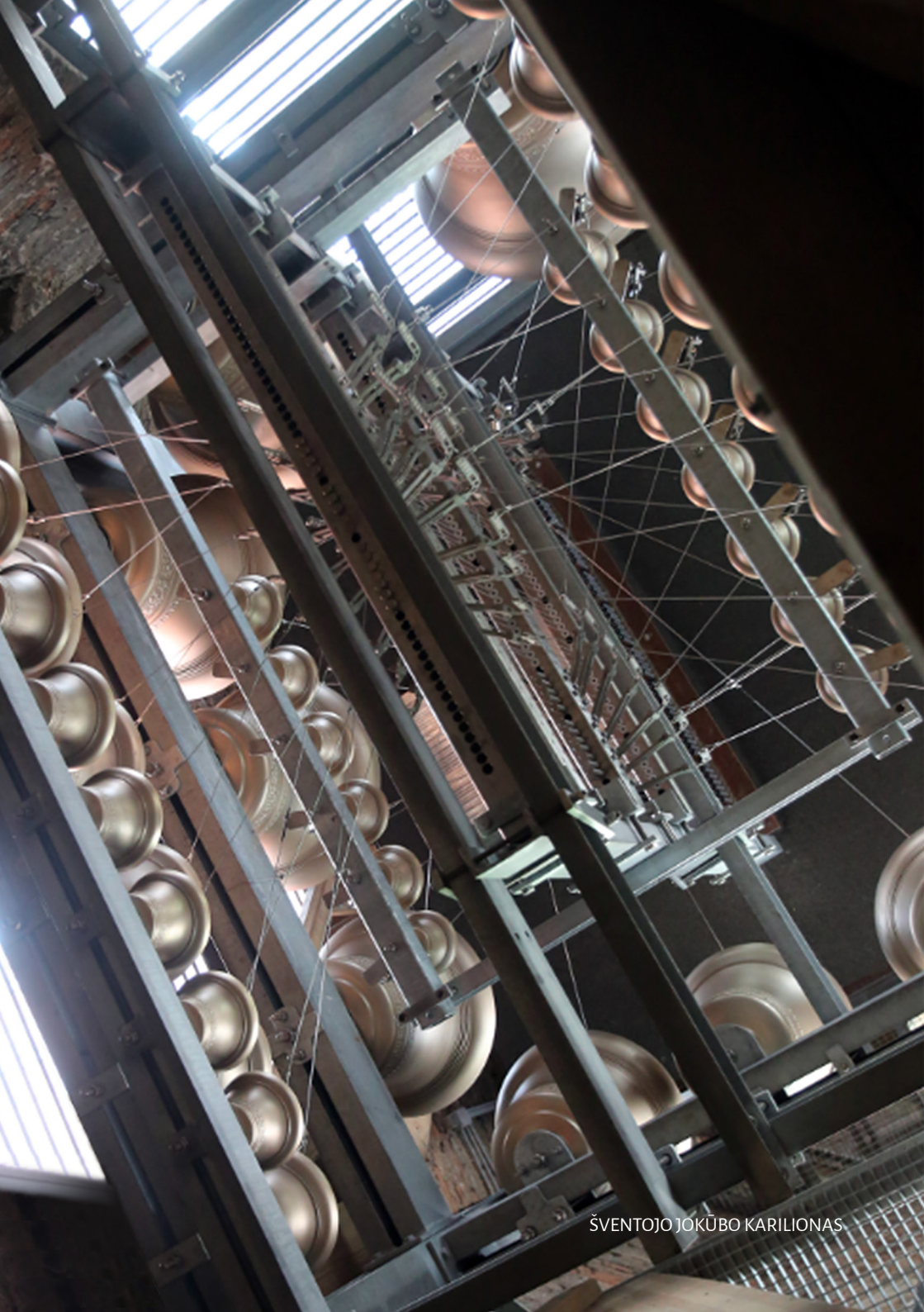
ŠVENTOJO JOKŪBO KARILIONAS